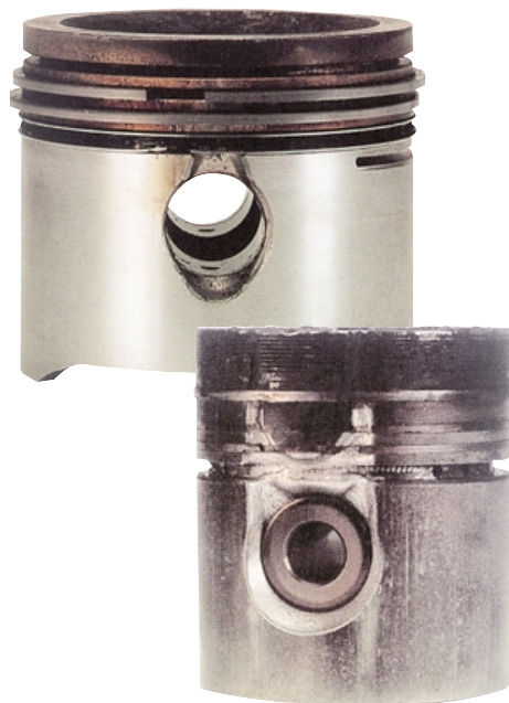
Выскакивание стопорного кольца поршневого пальца ведет к повреждению поршня у отверстия. При этом в цилиндре наблюдаются глубокие борозды от пальца.

Иногда в цилиндр могут попадать посторонние предметы. Такое чаще всего происходит при неаккуратной работе во время обслуживания или