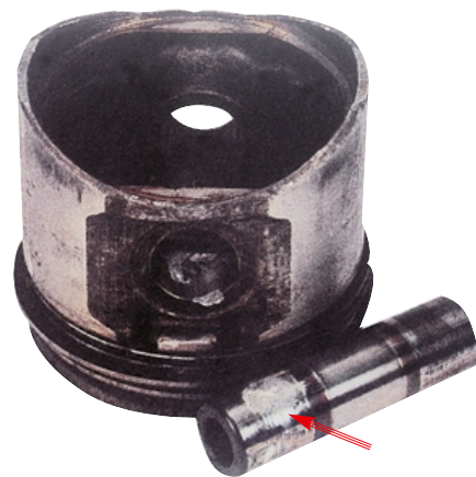
Схватывание пальца в отверстии бобышек поршня произошло сразу после запуска двигателя. Причина — малый зазор в соединении и недостаточная смазка.

Нарушение охлаждения поршня — едва ли не самая распространенная причина появления дефектов. Обычно это происходит при неисправности системы охлаждения двигателя (цепочка: «радиатор—вентилятор—датчик включения вентилятора—водяной насос») либо из-за повреждения прокладки головки блока цилиндров. Во всяком случае, как только стенка цилиндра перестает омываться снаружи жидкостью, ее температура, а вместе с ней и температура поршня, начинают расти. Поршень расширяется быстрее цилиндра, к тому же неравномерно, и в конечном итоге зазор в отдельных местах юбки (как правило, вблизи отверстия под палец) становится равным нулю. Начинается задиры — схватывание и взаим-