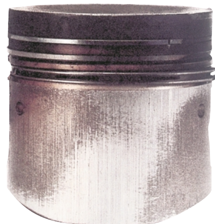
Деформированный шатун обычно приводит к несимметричному пятну контакта юбки с цилиндром из-за перекаса поршня.

Хотя это и очевидно, но при эксплуатации все-таки необходимо: содержать в исправности системы питания, смазки и охлаждения двигателя, вовремя их обслуживать, излишне не нагружать холодный двигатель, избегать применения некачественного топлива, масла и несоответствующих фильтров и свечей зажигания.