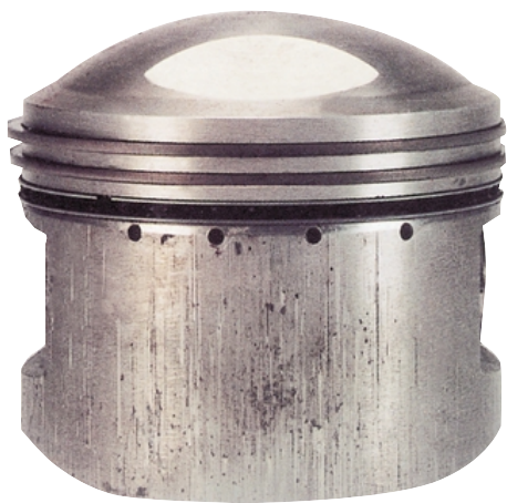
Плохая фильтрация масла послужила причиной абразивного износа юбки, цилиндра и поршневых колец.

располагаются, как правило, в средней части юбки, на ее нагруженной стороне.