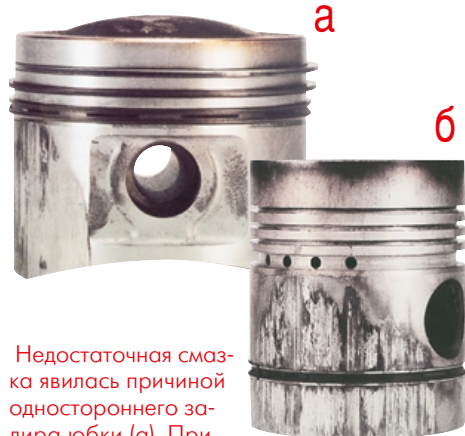
Недостаточная смазка явилась причиной одностороннего задира юбки (а). При дальнейшей работе в таком режиме задиры распространяются на обе стороны юбки (б).

В конструкции поршня могут быть и другие «хитрости». Одна из них — обратный конус в нижней части юбки, призванный уменьшить шум из-за «перекладки» поршня в мертвых точках. Улуч-